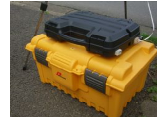
BATT制御器別々に運用可能商用電源があればADP使用で永久使用