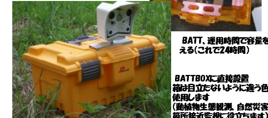
BATT、運用時間で容量を変える(これで24時間)