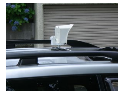
強力マグネットで車両に簡単取り付け(雨天、高低温、高速走行に耐えます)