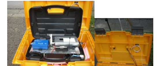
制御装置あけたところ