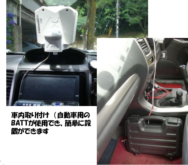
車内取り付け (自動車のBATTが使用でき、簡単に設置ができます)