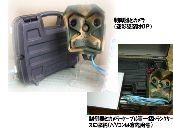
制御器とカメラ (迷彩塗装はOP)