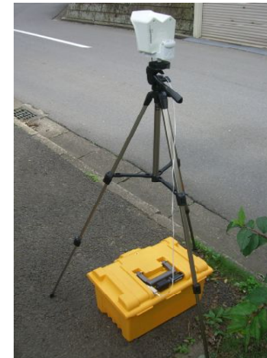
BATTと移動用三脚、簡単設置、カメラとLANケーブルをつなぐだけ設置完了